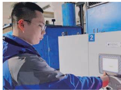
工作中调整设备参数