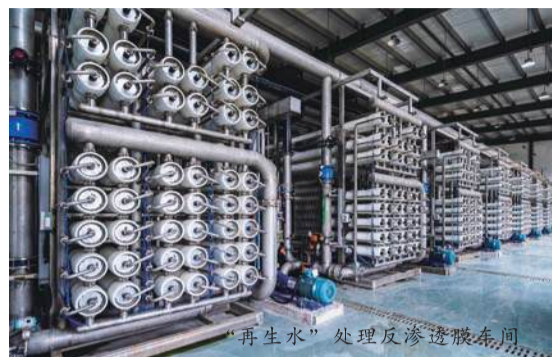
“再生水”处理反渗膜车间