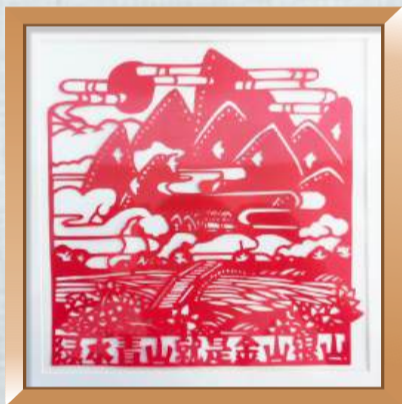
金山银山不如绿水青山