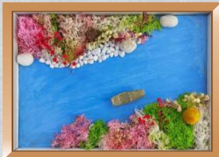
点滴积累 珍惜资源