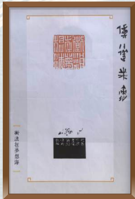
“冲浪在梦想海”印屏