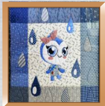
水灵节水布艺宣传画