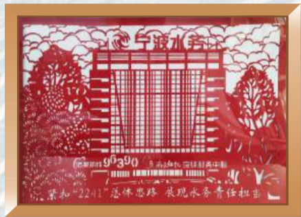
奋进新征程，建功新时代