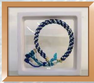
“森森玲珑情”编绳手串