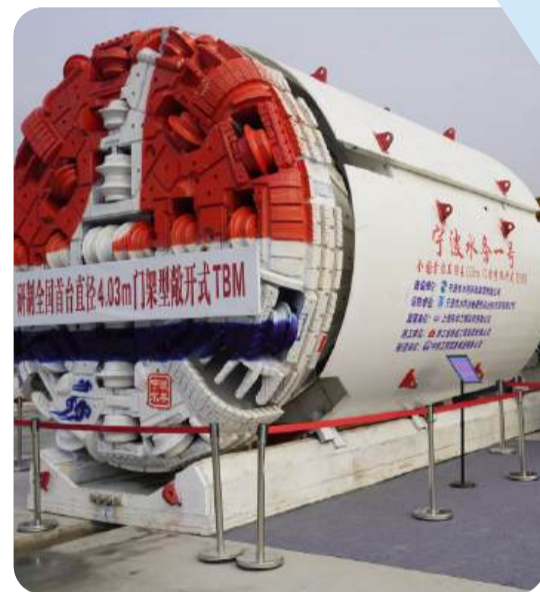
“宁波水务一号”是全国首台直径4.03m门架型敞式TBM。