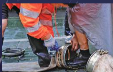
百丈东路太古社区强排设备全力排水。