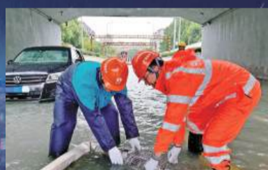
排水公司对苑西立交进行积水强排。

排水公司迅速响应，领导班子靠前指挥、科学部署，智慧排水调度中心高效运转、精准调度，各净化水厂及“橙青春防汛突击队”闻令而动、全力以赴，在风雨中筑起守护城市排水生命线的坚固堡垒。7月29日-30日，公司领导班子亲自挂帅，严格执行24小时值班值守制度，督导检查防汛工作落实情况。“中枢神经”——智慧排水调度中心实时监测液位、泵站及各厂运行情况，精准分析雨情水情，协调各厂站运行负荷及泵站启闭。各净化水厂时刻关注配电间及低洼易积水重点区域的排水工作，对于积水区域及时疏通雨水篦子、下水管道等厂区排水设施；定时巡查生产现场、变电所、仓库等重要构筑物，紧盯重要设备运行情况，及时处理各种应急事件。7月30日，“橙青春防汛突击队”奔赴苑西立交积水点协助开展强排工作，他们迅速架设泵车、铺设水带，成功抢通积水路段。未及休整，又根据调度安排马不停蹄奔赴下一个战场。这支“每月一训、每季一演”，历经大型保障任务淬炼的队伍，用训练有素的技能和守护城市的初心，在风雨中奔跑，成为一道亮丽而可靠的青春防线。（排水公司 杨怡）