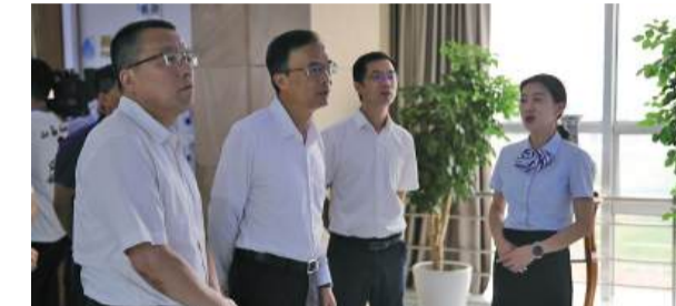
市人大常委会主任张平(左二)调研清泉热线。

7月29日上午，市人大常委会主任张平一行赴集团开展调研工作。集团党委书记、董事长谭国洪，党委委员、副总经理周正协及相关部门负责人参加调研。