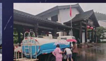
送水车开进毛岙村。