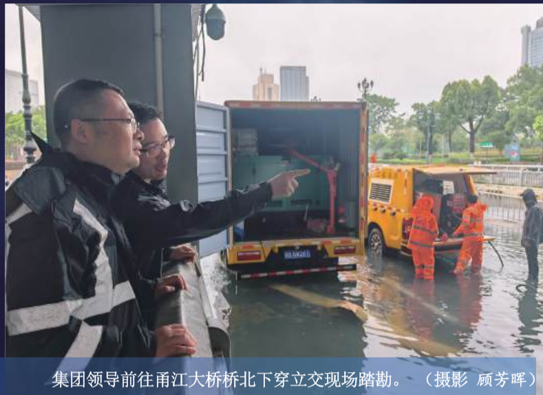
集团领导前往甬江大桥桥下立交现场踏勘。

7月30日，台风“竹节草”带来强降雨，致甬城多地积水。集团迅速响应，对中心城区“六横六纵”12条主干道及下穿立交进行重点保通。针对苑西立交、通途路悠云路路口、人民路下穿甬江大桥等积水路段，全力开展排水作业。9座沿江泵站开足马力运行，期间累计排水量达102.38万吨。（编写 吴文苍）