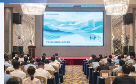
7月10日，集团参加宁波市属国资国企社会责任报告集中发布会。