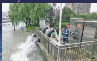
通途路悠云路路口强排设备全力排水。